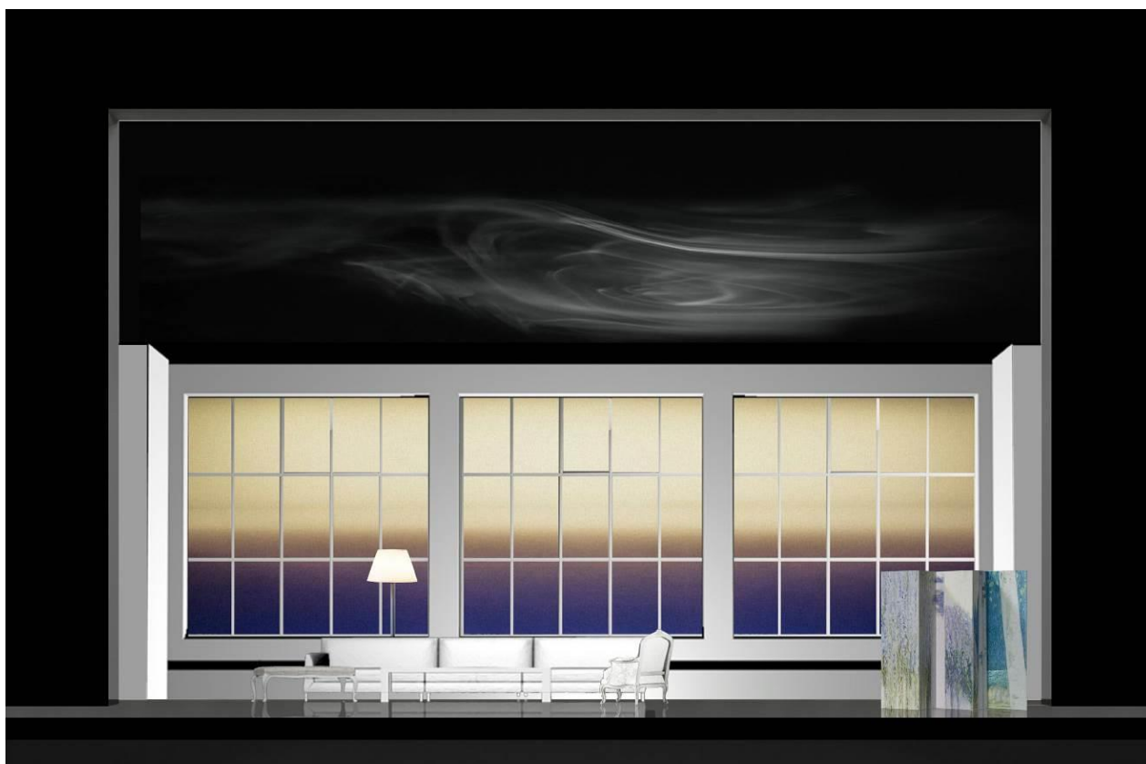
Bozzetto di Serena Rocco

Nuovo allestimento della Fondazione Arena di Verona